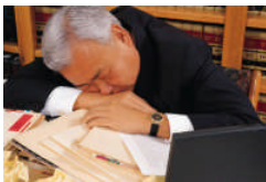
Kontakt D2R, - før det bliver dig!!

Dit selskab vil med fordel kunne outsource Compliance og HR. Områder der skal sikre, at virksomheden overholder best practice, - områder, som er vigtige, men ikke kerneområder for virksomhedens produktion.